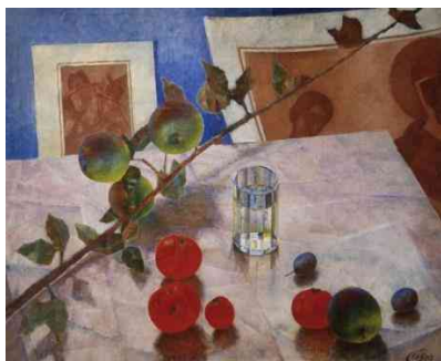
К. Петров-Водкин. Розовый натюрморт.

Натюрморт наиболее показателен и многообразен в плане изучения признаков декоративной стилизации. В нем работали многие большие мастера такие как К. Петров–Водкин, А. Матисс, шли по пути выявления декоративно – экспрессионистических возможностей цвета и фактуры.