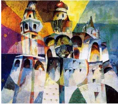
А. Лентулова. Звон (Колокольня Ивана Великого)

Представитель кубизма П. Пикассо стремился утвердить новые методы передачи пространства и формы, используя аналитический способ изображения предметов разложением их на простейшие геометрические объемы.