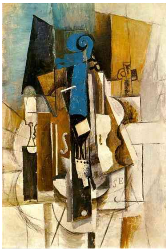
П. Пикассо. Скрипка в кафе.

Представитель кубизма П. Пикассо стремился утвердить новые методы передачи пространства и формы, используя аналитический способ изображения предметов разложением их на простейшие геометрические объемы.