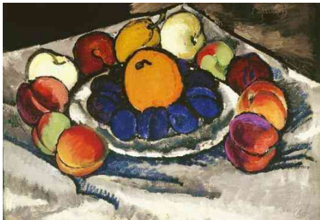
И. Машков. Натюрморт. Фрукты на блюде.

Фовисты создавали колористические контрасты интенсивных пятен и острые композиционные ритмы, часто обращаясь к примитивному, а также средневековому и восточному искусству. Декоративные натюрморты И. Машкова были созданы под влиянием кубистов и фовистов. Машкова называют «королем натюрмортов», и это звание вполне заслужено. «Фрукты на блюде» написаны в период освоения художником плоскостной живописи, жанра вывески.